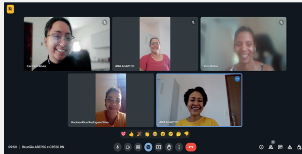
Print da reunião online

Desta maneira, como deliberação da reunião e com o intuito de ampliar o debate da temática para a categoria e estudantes, ficou agendada reunião ampliada virtual sobre o tema para o dia 28 de novembro, às 19h, com participação de representação da ABEPSS.