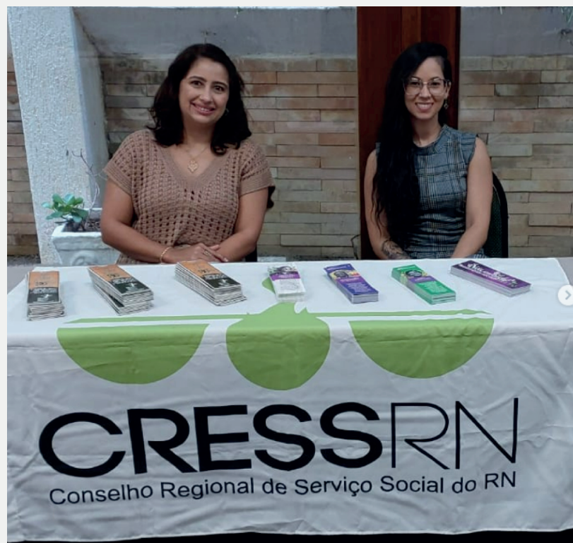
Fotos do evento

Na ocasião, servidoras/es da Política de Assistência Social destacaram que a desvalorização salarial impacta diretamente na qualidade da oferta dos serviços, programas, projetos e benefícios e na garantia das seguranças socioassistenciais à população.