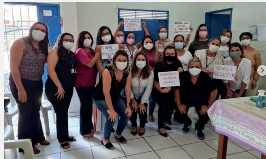
Foto da assembleia em São Gonçalo do Amarante

As/os trabalhadoras/es da Assistência Social estão em mobilização pela aprovação do Plano de Cargos e Salários, assim como em outros Municípios potiguares.