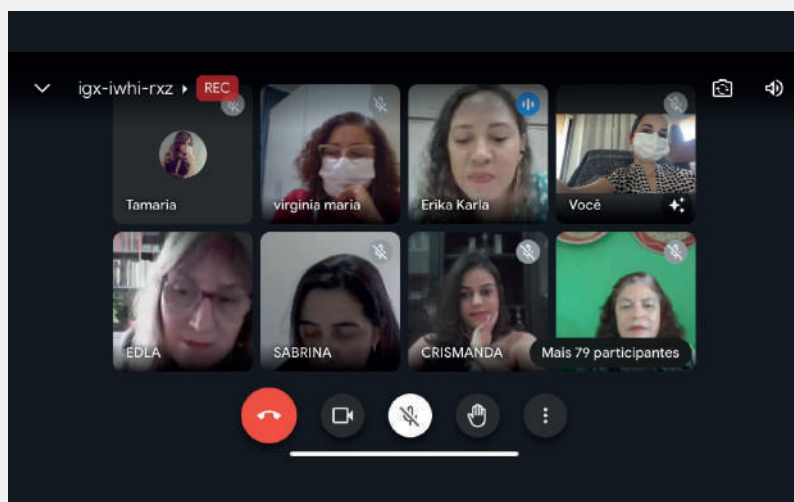
Print do XV Fórum de Estágio em Serviço Social da UFRN.