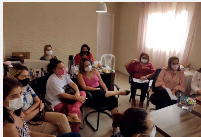
Foto da reunião com profissionais da Assistência Social de Parnamirim

Em reunião com profissionais que atuam na Assistência Social em Parnamirim, no dia 22 de setembro, o CRESS-RN defendeu o fortalecimento da Vigilância Socioassistencial para conhecer a realidade do Município e planejar a curto, médio e longo prazo a efetivação do SUAS.